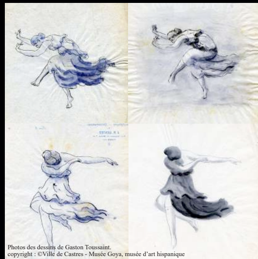
Photos des dessins de Gaston Toussaint. copyright : ©Ville de Castres - Musée Goya, musée d'art hispanique

Au Théâtre Municipal de Castres Vendredi 11 décembre 2020 à 10h00 et 14h30